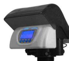
RX-79B/DVS-EC – ¾"