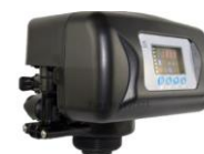
RX-92A/DVS - 1"