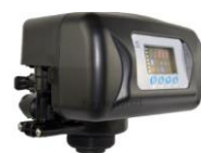
RX-92A/DVS - 1"