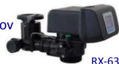
RX-63B/DVS - 1"