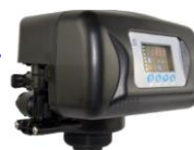
RX-92A/DVS - 1"