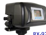
RX-92A/DVS - 1"