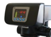
RX-67B/DTF - 1"