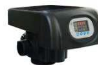
RX-75A/DTF - 2"